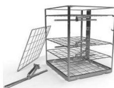
5段フレキシブルラック