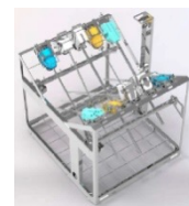
da Vinci Xi 用ラック