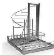
麻酔科用器具ラック