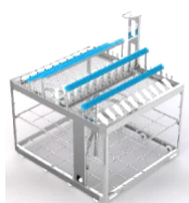
MIS (最小侵襲手術) ラック