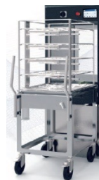
スライドドア 台車使用

前面が狭く、台車を置く場所がない : マニュアルドア 流し台や作業台が遠い : スライドドア+台車使用